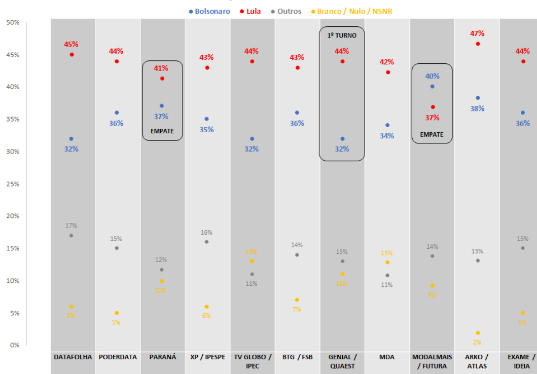
GRÁFICO DO % DE INTENÇÃO DE VOTO DE DIFERENTES INSTITUTOS

A onda de certeza que vem marcando esta eleição tem levado muitos a ignorar até questionamentos comuns, como (1) a ordem das perguntas nos questionários e o efeito deletério de fazer perguntas de contexto antes da intenção de voto; (2) o impacto do “shy voter” sobre a Não Resposta; e (3) a própria diferença absoluta no percentual de Não Resposta, sejam Brancos, Nulos, Nenhum ou Não Sabe no total do Brasil, e nos Estados e Regiões em particular.